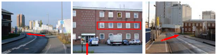
Aus Richtung Umgehungsstraße links abbiegen